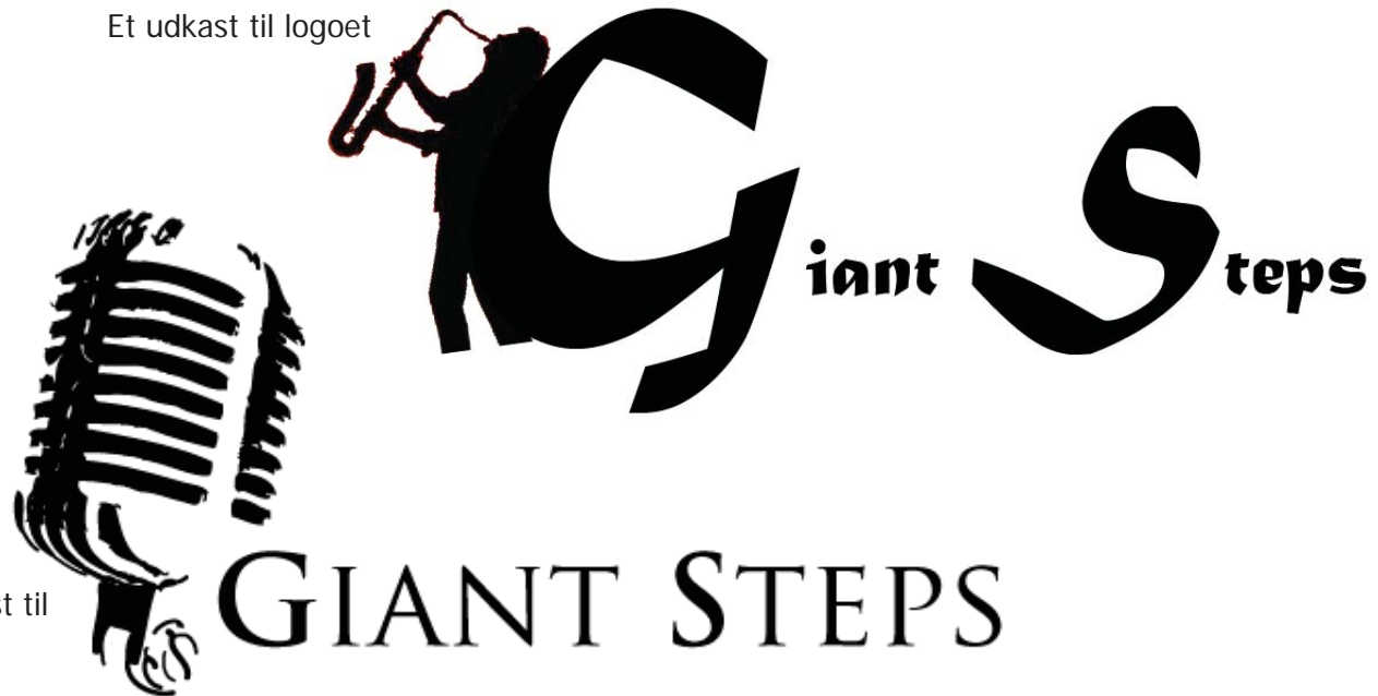
Et andet udkast til logoet