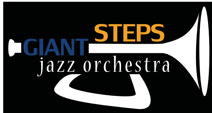
Det endelige logo

Det endelige logo havde originalt ikke sløjfen under "jazz orchestra" med, men det hjalp på det overordnede indtryk, da den kom med. Samtidig kan STEPS repræsentere ventilerne på trompeten.